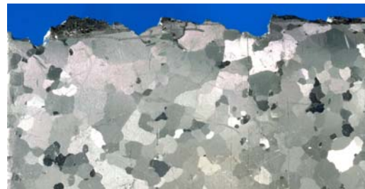
Makroschliff eines gerissenen Alubleches