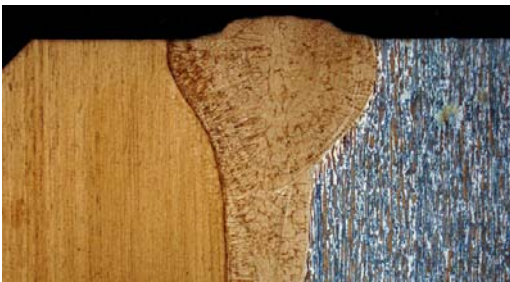
EB-Schweissung zweier unterschiedlicher Stähle

Unsere Metallographen können Ihnen vor allem bei der Qualitätssicherung und bei Fertigungsproblemen mit Rat und Tat zur Seite stehen. Mit Hilfe unserer modernen Auf- und Durchlichtmikroskopie können auf Makro- und Mikroschliffen Gefüge, Korngrößen oder Einschlüsse beurteilt werden. Unser gut ausgerüstetes Labor kann die Gefügebeurteilung auch ambulant und zerstörungsfrei durchführen. Die weiteren Bereiche unserer Metallographie reichen von der Härtemessung bis zur Restlebensdaueranalyse.